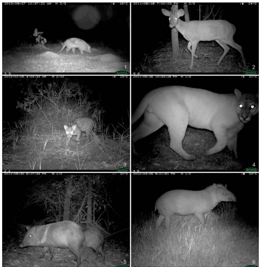
Figuras 1-6. Alguns exemplos de grandes mamíferos amostrados pelas “camera traps” do Projeto Sons do Pantanal: 1. tatu-canastra ( Priodontes maximus ), 2. veado-mateiro ( Mazama americana ), 3. jaguatirica ( Leopardus pardalis ), 4. onça-parda ( Puma concolor ), 5. cateto ( Pecari tajacu ), 6. anta ( Tapirus terrestris ).

Além disso, as “camera traps” registram também as espécies de mamíferos, seus rastros e documentam a captura das presas. Os mamíferos que produzem sons, mas que não são capturados pelas “camera traps” são registrados pelos gravadores automatizados. Como metodologia tradicional de monitoramen-